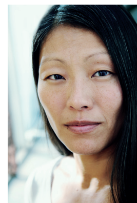
Författaren Sofia French